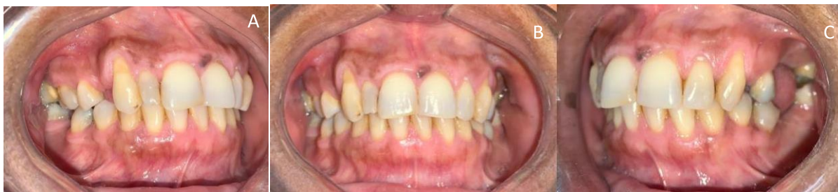
Figura 02: Fotos intra-orais pré-operatórias. (A) Fotografia da oclusão dentária do lado direito. (B) Fotografia da oclusão dentária em visão frontal. (C) Fotografia da oclusão dentária do lado esquerdo

Ao exame físico intra-oral notou-se aumento de volume em região de mucosa jugal a direita com aproximadamente 02 cm de diâmetro, endurecida a palpação, assintomática, mucosa estava com coloração normal e sem sinais de infecções ou processos inflamatórios, paciente apresentava ainda abertura bucal satisfatória.