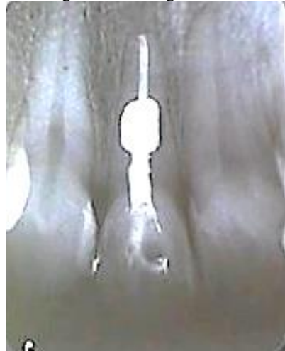
Figura 2- Radiografia final

Foram realizados exames radiográficos de preservação com cinco e dez anos após o tratamento, confirmando a cura da patologia. Figuras 3 e 4.