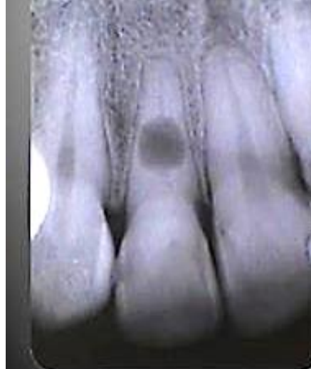
Figura 1 - Radiografia de diagnóstico mostrando reabsorção interna da raiz.

A paciente foi anestesiada com um tubete de Prilocaína com Felipressina, o dente foi isolado com dique de borracha e procedida a abertura técnica cirúrgica.