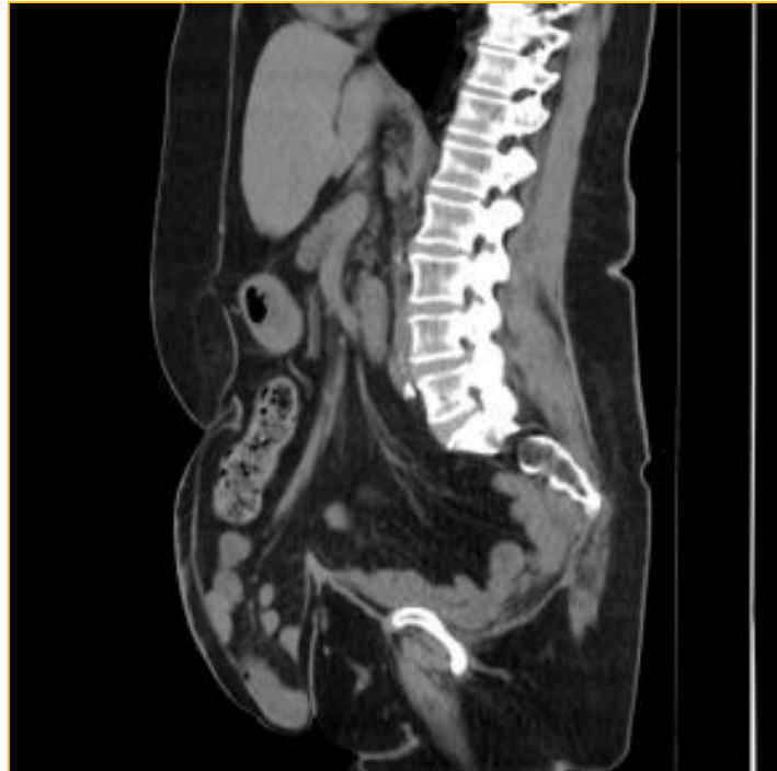
Figura 1 – cortes da tomografia computadorizada de abdome

Realizou 3 cirurgias prévias (duas cirurgias para tratamento metacrônico devido câncer colorretal, em 2011 e 2013, e uma reconstrução de trânsito intestinal). Ao exame físico abdominal foi constatado a presença de abaulamento em cicatriz cirúrgica de laparotomia na região da linha média, abaulamento em hipocôndrio direito e flanco esquerdo sobre cicatriz da incisão cirúrgica de colostomia, todos com proeminência à manobra de Valsalva, porém hipogastro sem redução manual. Foi solicitado tomografia de abdômen total para programação cirúrgica (figura 1).