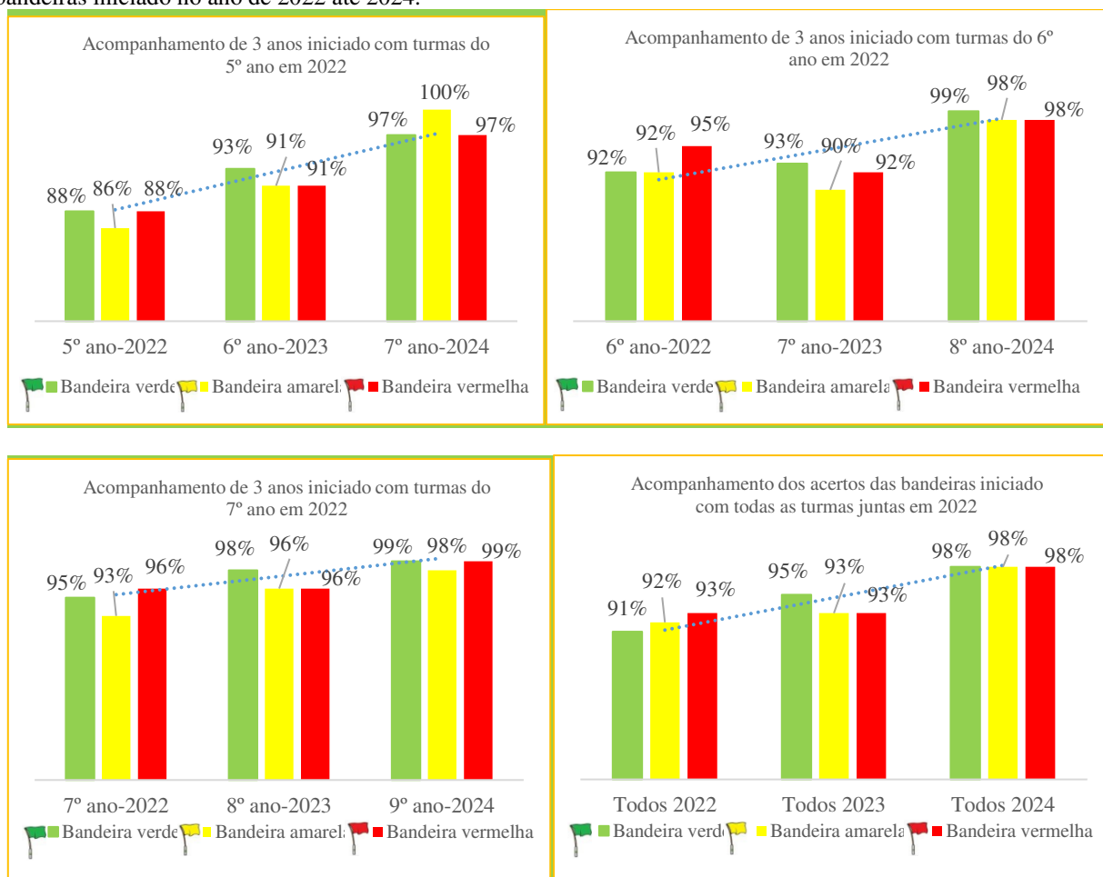
Gráfico 1: acompanhamento das turmas, por três anos, da prevalência de acertos sobre o significado das cores das bandeiras iniciado no ano de 2022 até 2024.

De fato, é importante ensinar o simbolismo das bandeiras, por exemplo, da bandeira amarela que indica “cuidado”, além disso, Woods et al. (2022) mencionam que algumas pessoas interpretam erroneamente a bandeira amarela como sendo áreas privadas de natação. Além disso, o vermelho indica “pare imediatamente” e neste contexto pode ser utilizada para impedir a movimentação/ utilização de um ambiente aquático (VASCONCELLOS et al., 2022). Já a bandeira verde significa local “liberado” para banho, mas vale enfatizar que nenhum local é totalmente seguro e por isso a atenção focada nas crianças que estão na água é muito importante.