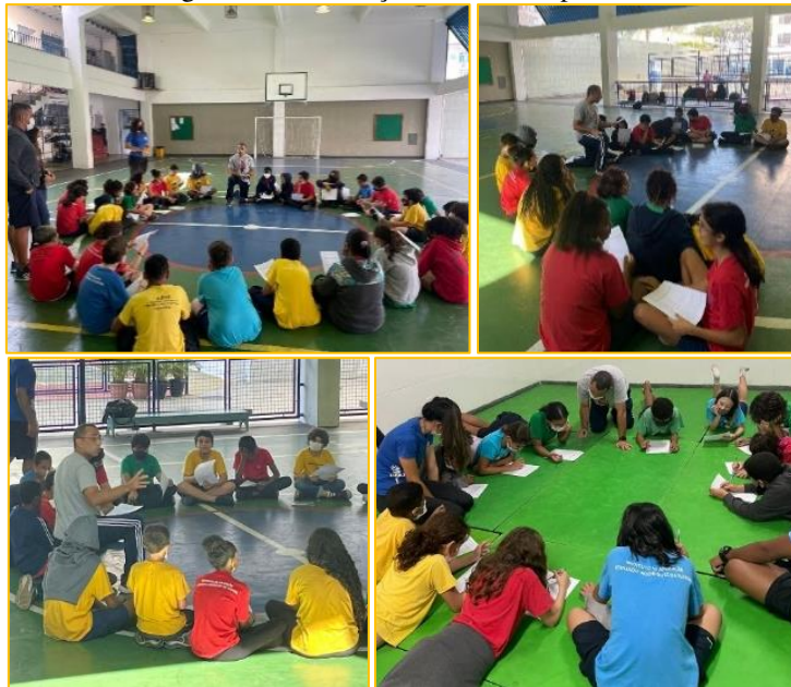
Figuras 1: intervenção feita no CAp UERJ

Cada turma recebeu três intervenções devolutivas do questionário (2022, 2023 e 2024) que duraram em média 40 minutos. Durante este tempo os pesquisadores também facultaram os alunos perguntarem sobre prevenção de lesões no ambiente aquático.