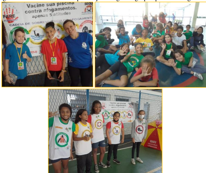
Figuras 2 xerifes da turma da prevenção e Figura 3 grupo “pare” os afogamentos

Na intervenção pedagógica, ao abordar o conteúdo conceitual em relação ao que se deve saber para executar uma ação procedimental, o aluno aprendeu sobre como “saber fazer, executar”, como, por exemplo, os procedimentos adequados de entrar na água em local raso e/ou fundo, de como nadar em uma situação de “cair na corrente de retorno”, das diferenças entre nadar na piscina e no mar, de como ajudar alguém ao fornecer um objeto flutuante ao invés de mergulhar para tentar salvar e virar uma vítima. Para Moreland et al. (2022) essas intervenções podem abordar também o uso consistente de coletes salva-vidas em barcos e entre nadadores que não tem muita habilidade aquática em águas naturais, pois isso, tem o potencial de reduzir as mortes por afogamento.