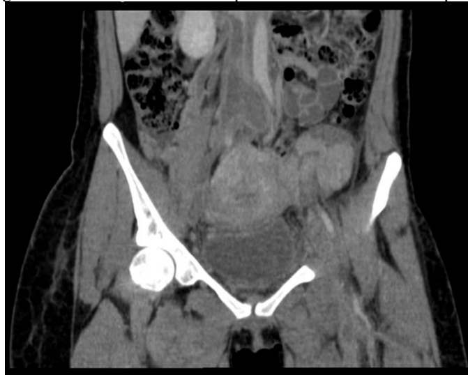
Figura 1: corte coronal de TC de pelve com contraste na fase portal.

identificado. Evoluiu com dor em região inguinal à esquerda durante o período investigatório e, após realização de nova US doppler, confirmou-se outra TVP no MIE. Continuada a investigação diagnóstica com tomografia computadorizada (TC) de abdome sem contraste, visualizou-se pequena coleção perivesical, podendo corresponder a edema residual pós cirurgia, na TC evidenciou-se trombose venosa na porção infrarrenal da veia cava inferior, nas veias ilíacas comuns externas e internas, nas femorais comuns, bilaterais, e na porção infrarrenal da veia cava inferior. Iniciou antibioticoterapia (ATBT) com meropenem 1g intravenoso (IV) 8/8h e gentamicina e uma nova TC com contraste foi solicitada, na qual evidenciou-se edema nos planos adiposos da região pélvica associado à TVP em: porção infrarrenal da veia cava inferior; veias ilíacas comuns, externas e internas; veias femorais comuns bilaterais e veia ovariana direita. Após manutenção por cinco dias do uso combinado de ATBT e ACO, houve regressão total dos sintomas.