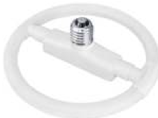
Figura 4: Lâmpada fluorescente circular