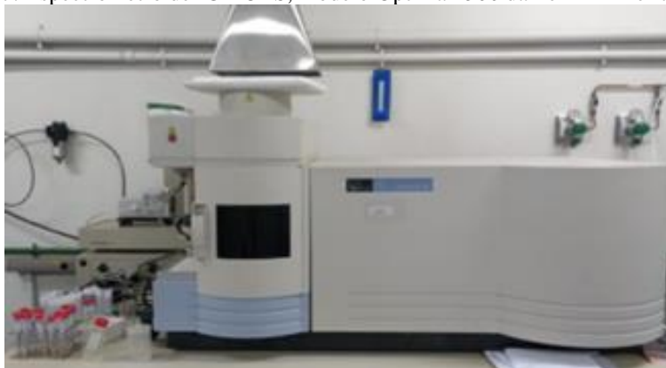
Figura 7: Espectrômetro de ICP-OES, modelo Optima 4300 da PerkinElmer utilizado.

Quanto ao ajuste de calibração do equipamento, podem ser observados os valores de calibração na tabela 2, abaixo.