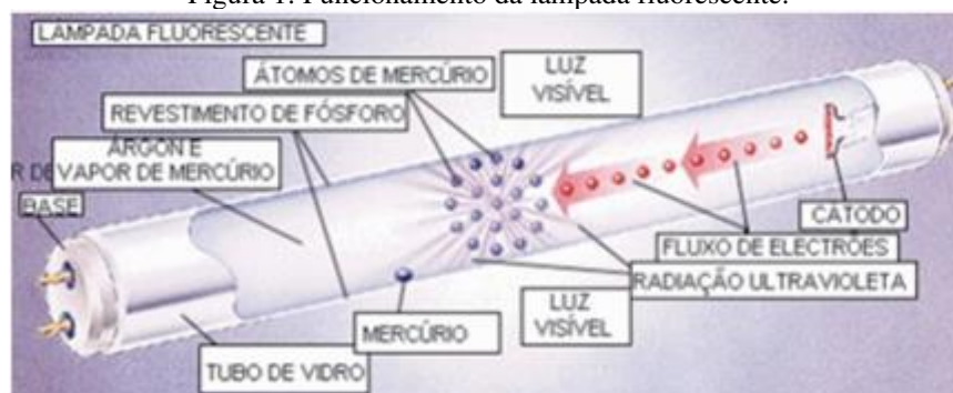
Figura 1: Funcionamento da lâmpada fluorescente.

Segundo Júnior e Windmöller (2008) o processo de iluminação artificial pela técnica de lâmpadas fluorescentes compreende o princípio de emissão de luz a partir de um tubo de vidro transparente, com dois eletrodos, um em cada extremidade, uma mistura de gases à baixa pressão (um gás nobre inerte, normalmente argônio, somado a vapor de mercúrio) e um material luminescente que reveste internamente o tubo, geralmente pó de fósforo. Quando o interruptor é ligado, os eletrodos emitem elétrons, que colidem com os átomos de mercúrio (Hg), presentes no interior da lâmpada, causando assim a emissão de energia em forma de radiação ultravioleta (UV). Conforme relatam Júnior e Windmöller (2008) a emissão de luz se dá, pois a camada fluorescente, que reveste a superfície interna do tubo, convertendo essa radiação em luz visível. Na figura 1 pode-se observar o dispositivo luminescente em detalhes.