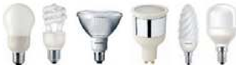
Figura 3: Lâmpadas fluorescentes compactas