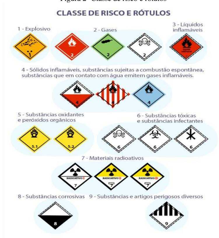
Figura 2- Classe de risco e rótulos