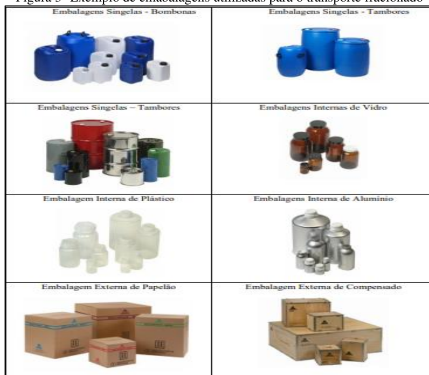
Figura 3- Exemplo de embalagens utilizadas para o transporte fracionado