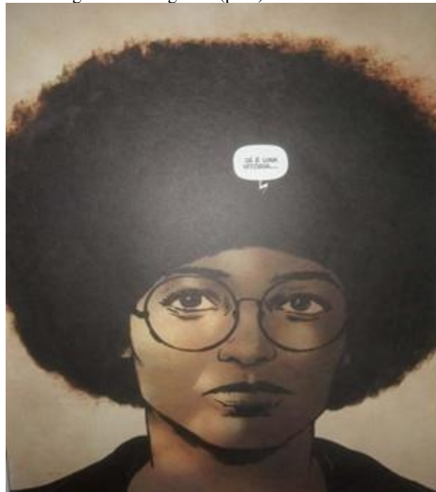
Figura 5 – Imagem 6 (p.25): Já é uma vitória

Nesses dois quadrinhos, há dois personagens: o participante do grupo Panteras Negras e Angela Davis. O texto nos dois quadrinhos condiz com a imagem de alívio. As faces dos personagens não representam medo, nem agressividade, nem alegria, nem revolta, e sim alívio.