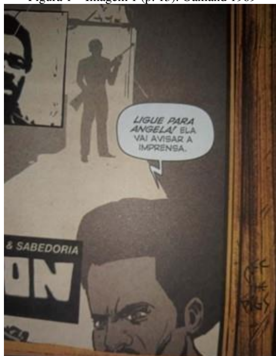
Figura 1 – Imagem 1 (p. 13): Oakland 1969

A imagem da Figura 1 retrata um homem do grupo Panteras Negras pedindo para alguém ligar para Angela Davis, para que ela possa avisar a imprensa. No momento, ocorria uma invasão policial contra a sede do grupo Panteras Negras, às 4h30min. A frase “ LIGUE PARA ANGELA! ” está em negrito, indicando a expressão de raiva tanto na fala quanto na expressão facial do personagem, o que sugere uma ordem incisiva.