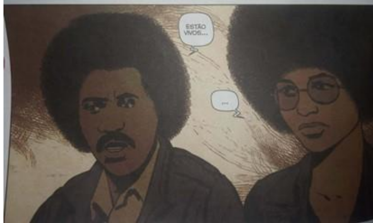
Figura 4 – Imagem 5 (p. 24): Os afro-americanos atacados pela polícia no partido Panteras Negras estão vivos

invasão policial acabar sem homens afro-americanos mortos “JÁ É UMA VITÓRIA”, como diz Angela Davis.