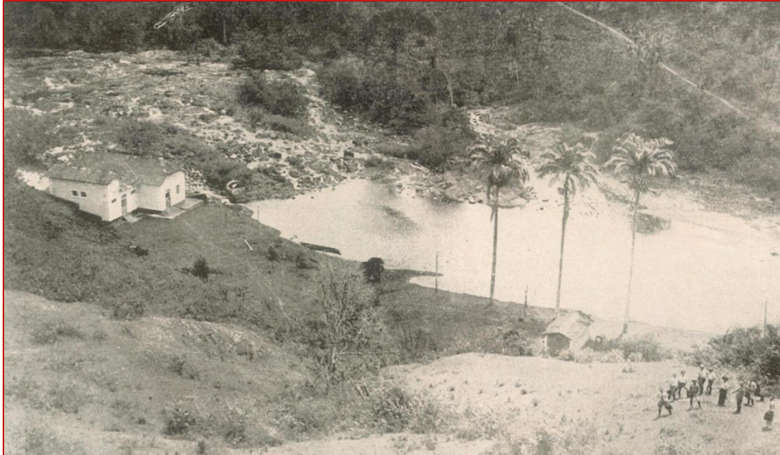
Figura 2 – Foto Usina do Almada publicada em 1938.

A iluminação pública foi inaugurada em Ilhéus no ano de 1890 por meio de luminárias à querosene. No último dia de 1910 a cidade conheceu a iluminação pública por meio da queima de gás acetileno (CAMPOS, 2006, p.499). Ilhéus veio a conhecer a iluminação pública elétrica em 2 de março de 1916 (CAMPOS, 2006, p. 535) possivelmente essa iluminação ainda não provinha de uma fonte gerada pela via hídrica, pois a concessão para o funcionamento da Usina do Almada, conhecida também na época como Usina do Itaípe 1 , foi dada em 15 de julho de 1916 à Companhia e Luz e Força (BAHIA, 1920).