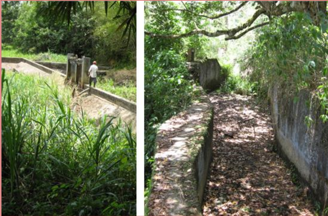
Figura 4: À esquerda vista da barragem da Usina do Almada na Fazenda Bonfim e á direita foto do canal de pedra na mesma fazenda. O fluxo de água da usina era controlado manualmente por comportas operadas por engrenagens.

A barragem (Figura 4) de água ficava noutra fazenda, a Fazenda Bonfim, localizada a aproximadamente 1500m rio acima. A água vinha por um riacho de 800m de comprimento, construído artificialmente e dividindo o leito do rio formando uma ilha artificial conhecida como Ilha do Cacau . Depois a água entrava num canal de pedra e concreto de 2m de largura, 1,5m de altura e 1300m de comprimento, para então, a 130 m da usina, ser canalizada em dutos metálicos de 1,3m de diâmetro. A declividade do terreno da barragem até a usina é de 0,001 por metro e a descarga de água era de 5,3m 3 por segundo (BAHIA, 1920). Já no porão da usina a água se dividia em três tubos menores para alimentar os geradores (informação verbal).