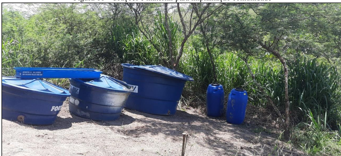
Figura 10 – doações e matérias para implantação comunidade