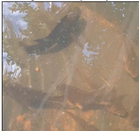
Figura 8 – Produção Tilápias