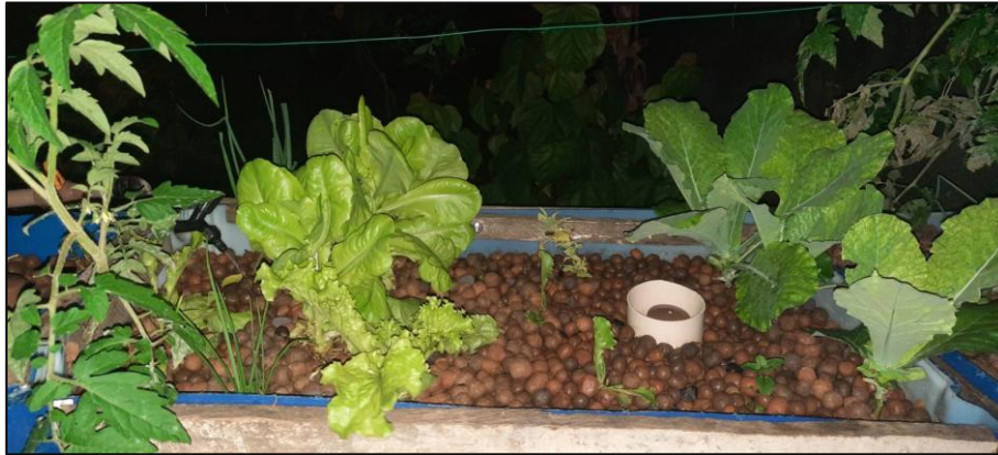
Figura 4 – alface, couve, cebolinha e tomate cereja