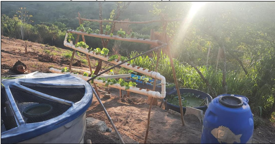
Figura 12 – projeto comunitário de aquaponia residencial