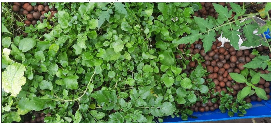
Figura 6 – agrião, menta e tomate cereja