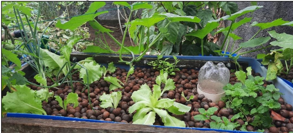
Figura 5 – cebolinha alface, hortelã, abóbora