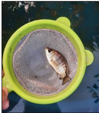
Figura 7 – Peixes da fase de alevinos para fase jovem

Quando o termo desperdício é tratado nesse estudo, podemos falar também no gasto de água para manter as hortaliças de forma convencional, o que gera um custo na produção. Na aquaponia esse gasto com água reduz de 85% a 90%. Sendo só necessária a troca da água quando parâmetros químicos estiverem elevados. A figura 8 nos mostra a qualidade da água em modelo de recirculação conhecido como RAS, sem a necessidade de troca de água e desperdício.