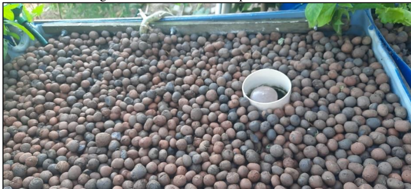
Figura 3 – Cama de cultivo para início testes