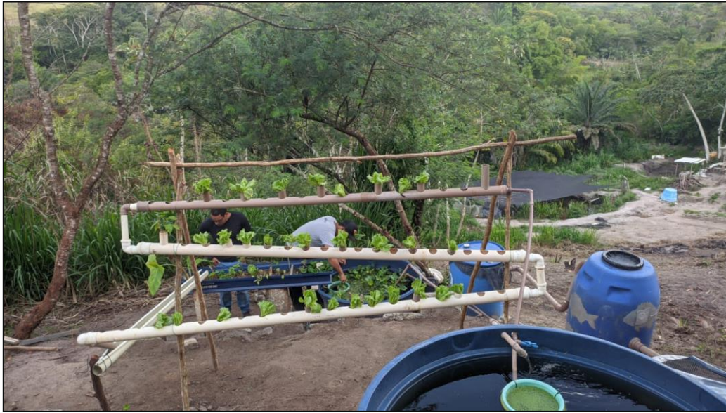
Figura 11 – Implantação do projeto de extensão e inovação – Aquaponia residencial

Fonte: implantação comunidade cidade de Cachoeira - BA