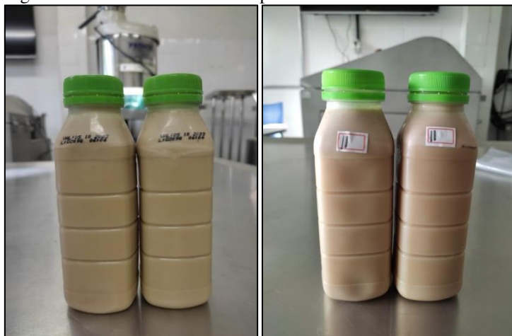
Figura 2: Deslocamento do soro após 3e 22 dias de armazenamento.

A estabilidade da bebida em relação à sinérese é um aspecto positivo, pois a presença excessiva de soro pode comprometer a textura e a qualidade sensorial do produto. Uma menor separação do soro também pode indicar uma boa coesão e estrutura do produto, o que contribui para uma experiência sensorial agradável ao consumir a bebida. A Figura 2 mostram o deslocamento do soro na garrafa entre o primeiro e o último dia.