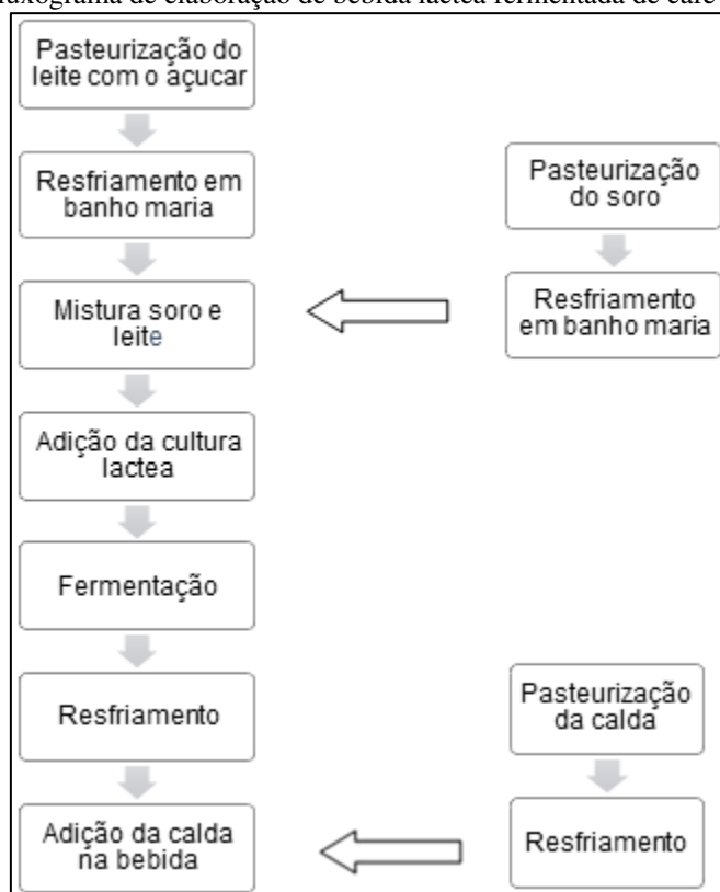
Figura 1: Fluxograma de elaboração de bebida láctea fermentada de café com amarula

Primeiramente, o leite e o soro foram acondicionados separadamente em recipientes previamente higienizados para seguirem para a etapa de pasteurização. O leite foi acrescido de sacarose antes do tratamento térmico a 90°C/5 minutos. A pasteurização do soro, com mesmo binômio, teve como objetivo principalmente inativar as enzimas utilizadas na produção do queijo e à destruição dos microrganismos patogênicos e deteriorantes. Em seguida, as matérias-primas foram resfriadas até 42°C, tendo como objetivo promover condições favoráveis para o crescimento da cultura láctea, prosseguindo para a etapa de mistura, respeitando as proporções das formulações propostas pelo trabalho.