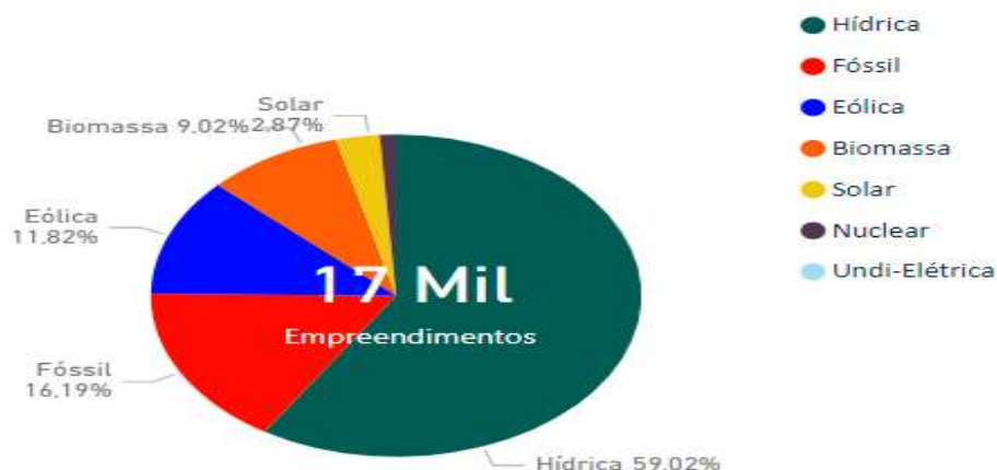
Gráfico 2: Fontes de energia em empreendimentos

Observa-se no gráfico acima que a Usina de Fotovoltaica (UFV - Solar) tem percentual muito baixo de utilização. As usinas de energia termoelétrica (UTE) poderão ser substituídas pelos sistemas de energia limpa, contribuindo no sistema de meio ambiente e na sustentabilidade.