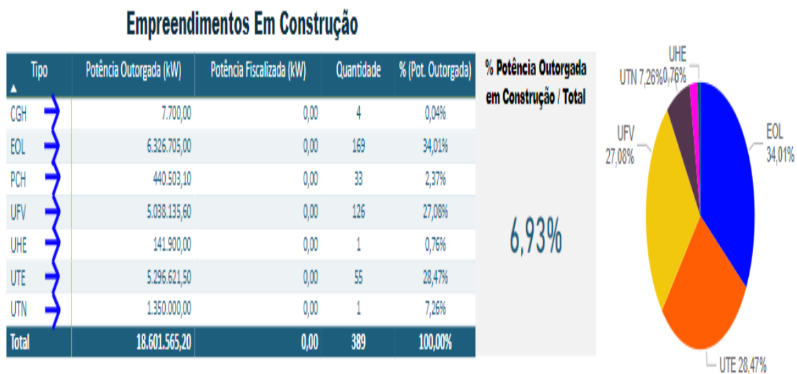
Figura 2: Empreendimentos em construção não-iniciada e fontes de energia