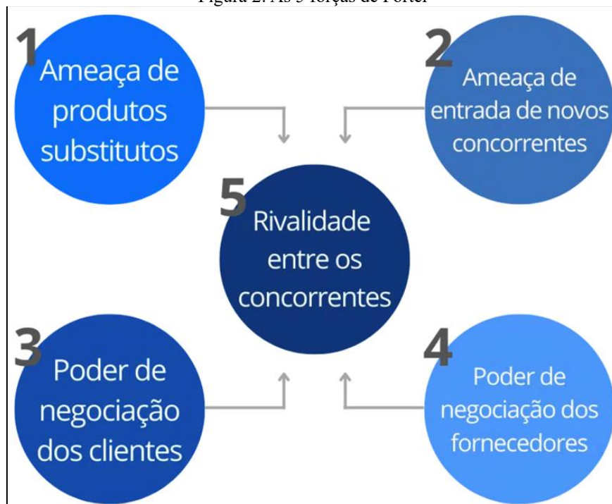
Figura 2: As 5 forças de Porter