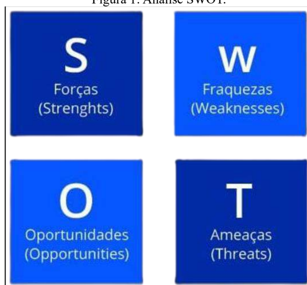
Figura 1: Análise SWOT.