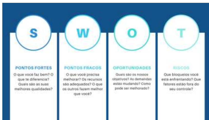
Figura 2: Análise SWOT