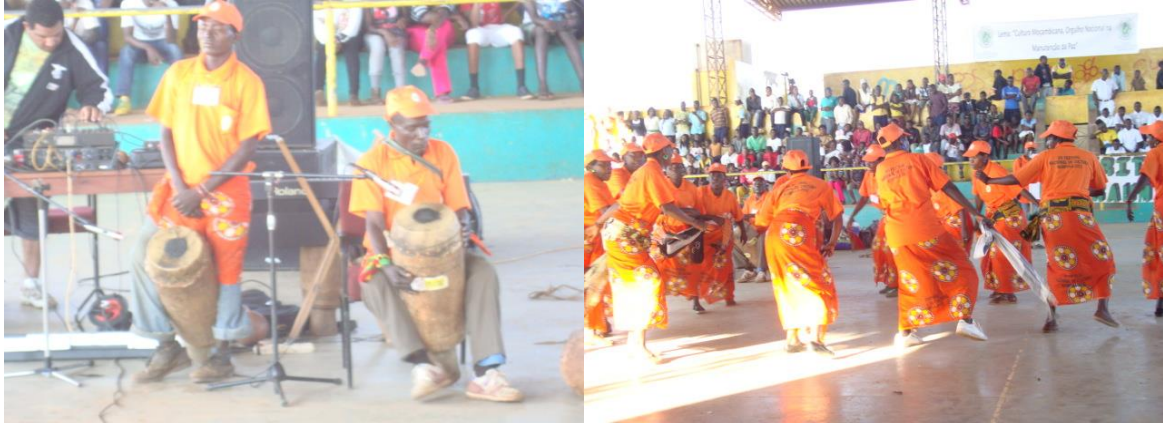
Foto 1: - Os dois homens que tocam a batucada acompanhando as mulheres na dança Chioda.