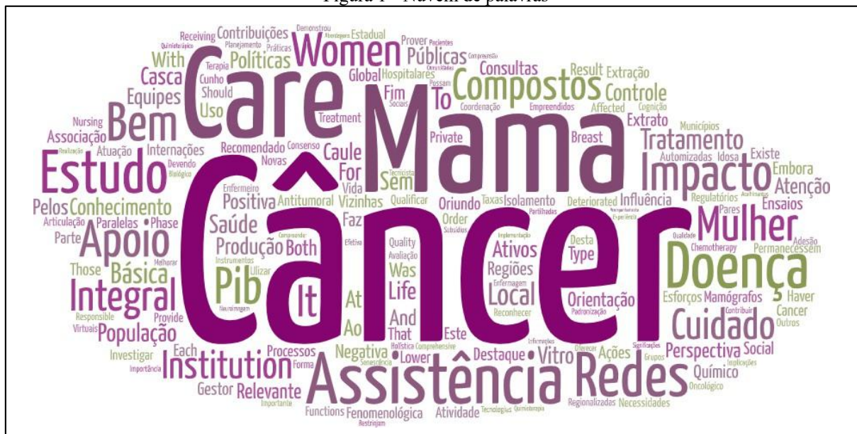
Figura 1 - Nuvem de palavras

O corpo textual foi analisado por meio da frequência de palavras, que originou a nuvem de palavras (Figura 1) criada na Plataforma online WordArt. Esta ferramenta agrupa e organiza graficamente as palavras-chave evidenciando-as as mais frequentes.