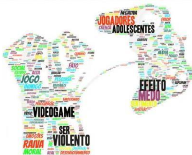
Figura 1 - Nuvem de palavras

O corpo textual foi analisado por meio da frequência de palavras, que originou a nuvem de palavras (Figura 1) criada na plataforma online WordArt. Essa ferramenta agrupa e organiza graficamente as palavras-chave evidenciando as mais frequentes.