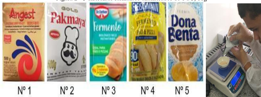
Figura 2 - 5 diferentes fermentos enumerados de 1 a 5, 10g

Fermentos que foram usados e pesagem dos fermentos que foram adicionados no caldo de cana.