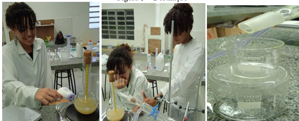
Figura 5 – Destilação

Após uma semana de fermentação foi iniciado a etapa de destilação (Figura 5), com a medição alcoólica de cada caldo fermentado para termos os volumes iniciais e finais e comparar o desempenho de cada fermento, e obtivemos os seguintes resultados (Quadro 4).