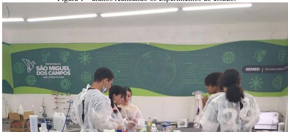
Figura 1 – alunos realizando os experimentos do estudo.

A pesquisa foi realizada no Centro educacional de Pesquisa, Robótica e Inovação (CEPRI), no município de São Miguel dos Campos – AL, com alunos do 9º Ano do ensino fundamental de uma escola pública municipal (Figura 1)