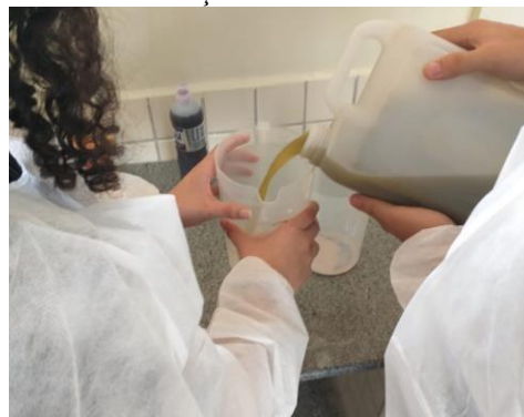
Distribuição do caldo de cana.