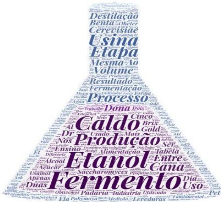
Figura 6 - Nuvem de palavras

O corpo textual foi analisado por meio da frequência de palavras, que originou a nuvem de palavras (Figura 6) criada na Plataforma online WordArt. Esta ferramenta agrupa e organiza graficamente as palavras evidenciando as mais frequentes.