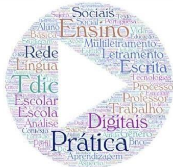
Figura 1 - Nuvem de palavras