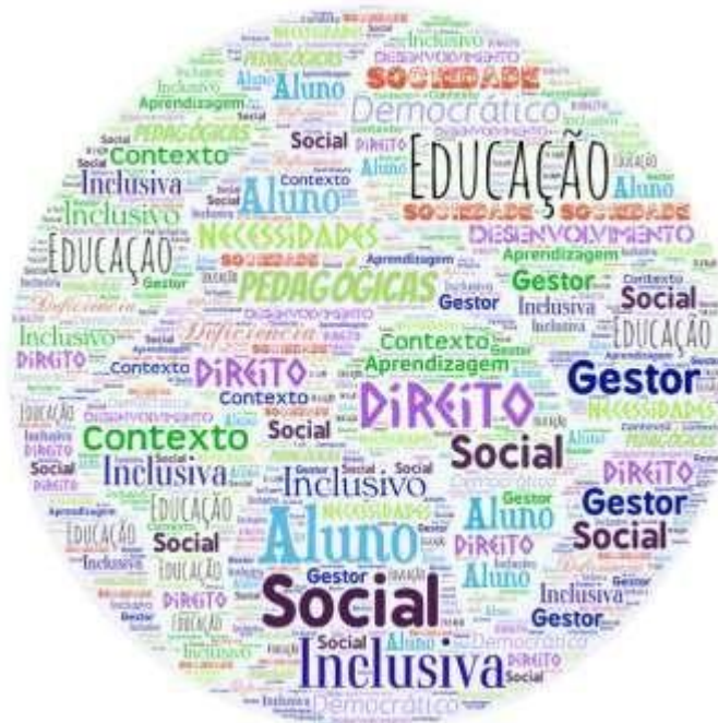
Figura 1 - Nuvem de Palavras

A plataforma WordArt é uma ferramenta que agrupa e organiza graficamente as palavras-chave demonstrando as mais frequentes, contribuindo para definição das categorias que irão compor o presente estudo.