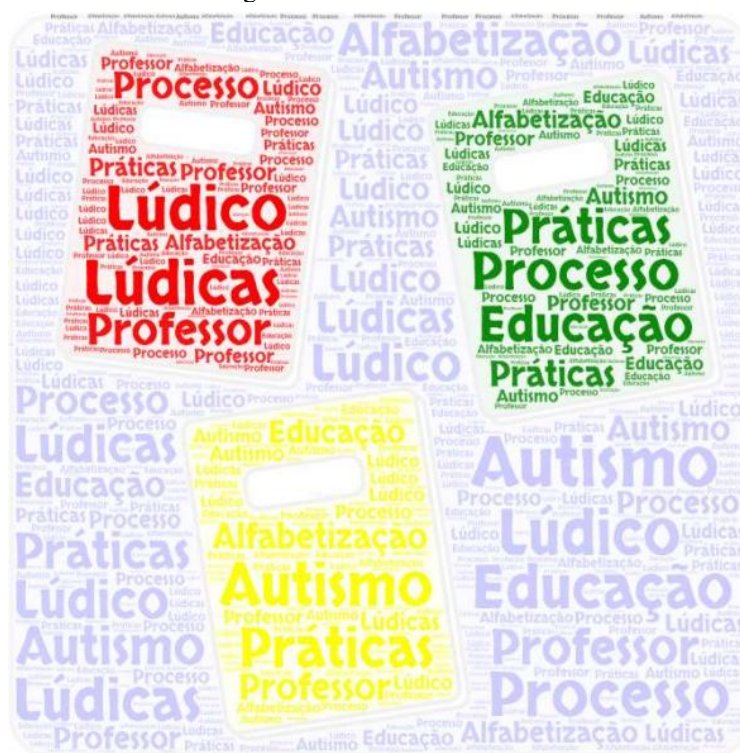
Figura 1 - Nuvem de Palavras