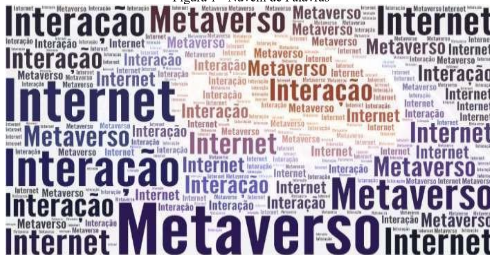
Figura 1 - Nuvem de Palavras

Por meio da análise da frequência das palavras presentes no corpo textual supradito, foi gerada a nuvem de palavras (Figura 1), utilizando a plataforma online WordArt.