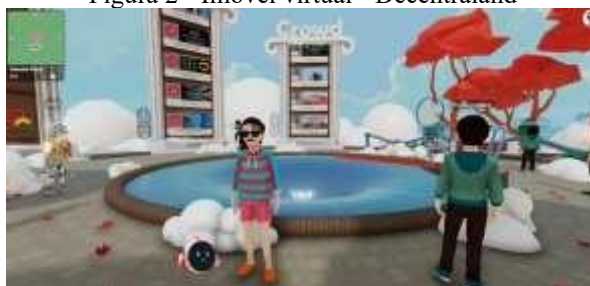
Figura 2 - Imóvel virtual - Decentraland

Shows realizados no Metaverso estão crescendo em popularidade. Artistas como Ariana Grande, Justin Bieber, Emicida, Gloria Groove e Rael fazem suas apresentações em jogos como Fortnite e Avakin Life, além de plataformas como Roblox e The Sandbox. Porém, o DJ Marshmello foi o pioneiro no Fortnite, atraindo 10,7 milhões de jogadores simultâneos, enquanto o rapper Travis Scott se apresentou para 14,8 milhões de usuários síncronos no início da pandemia 24 . Doutro giro, em relação ao setor imobiliário cibernético, o The Metaverse Group é dono de diversas propriedades digitais no Metaverso e investiu mais de US$ 10 milhões na compra dessas áreas virtuais, o que o tornou uma das principais empresas do setor 25 . Em 2021, um terreno foi vendido por 618 mil MANA à empresa Tokens.com, que desembolsou US$ 2,4 milhões na época 26 . Note-se um exemplo de imóvel virtual na Figura 2.