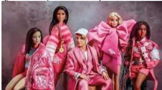
Figura 3 - Coleção de NFTs em parceria com a Barbie