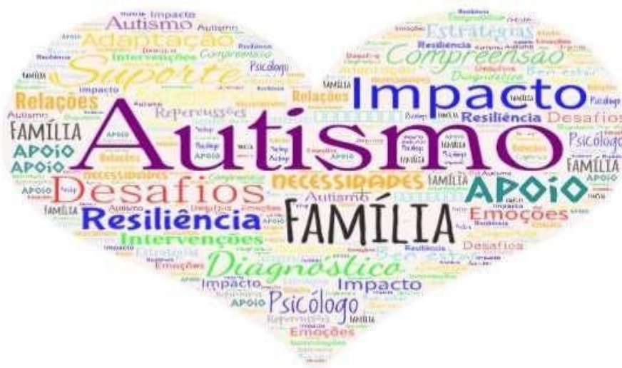
Figura 3 – Nuvem de Palavras

O conteúdo desses 20 estudos foi então submetido a uma análise de frequência de palavras, o que culminou na criação de uma representação visual das palavras em uma nuvem de palavras (conforme ilustrado na Figura 2), utilizando a plataforma de processamento de texto online WordArt. Essa ferramenta efetivamente agrupa e visualiza de maneira gráfica as palavras-chave, destacando aquelas que aparecem com maior frequência.