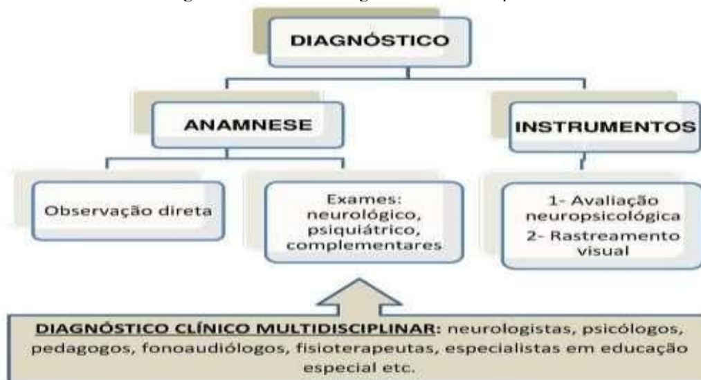
Figura 2 – Modelo de Diagnóstico Multidisciplinar