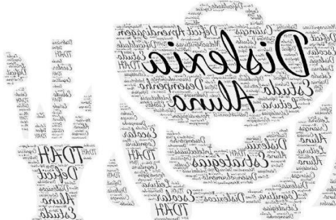
Figura 1 – Nuvem de palavras