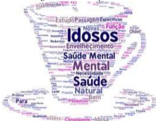
Figura 1. Nuvem de palavras