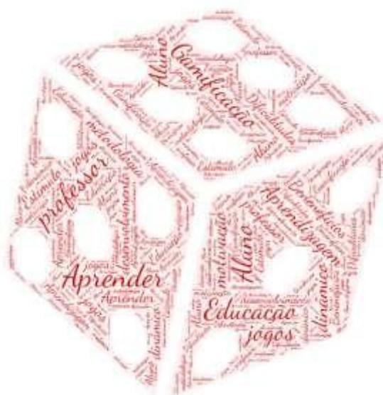
Figura 1 – Nuvem de Palavras

A plataforma WordArt é uma ferramenta que agrupa e organiza graficamente as palavras-chave demonstrando as mais frequentes, contribuindo para definição das categorias que irão compor o presente estudo.