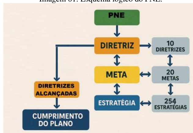
Imagem 01: Esquema lógico do PNE.

Podemos compreender o modelo lógico do PNE da seguinte forma: cada diretriz corresponde a um objetivo a ser alcançado; para cada objetivo, foram definidas metas(ações) que servem como caminho a ser seguido. As estratégias dentro de cada meta são os passos necessários para o seu cumprimento. O conjunto de metas atingidas resulta no cumprimento de uma diretriz, e o total de diretrizes alcançadas, em tese, soma-se ao cumprimento integral do plano de acordo com o esquema (Imagem 01):