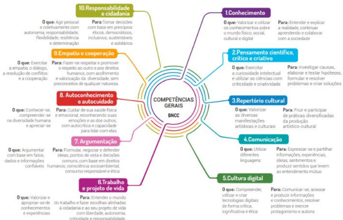
Figura 1 – Dimensões e desenvolvimento das Competências Gerais da BNCC.

A Base Comum Curricular assegura aos discentes o desdobramento de dez competências gerais reconhecendo que a “educação deve afirmar valores e estimular ações que contribuam para a modificação da sociedade, tornando-a mais humana, socialmente justa e também voltada para a preservação da natureza”. (Brasil, 2017)