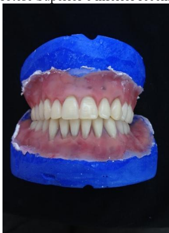
Figura 06 Prótese Superior e inferior recém demufladas

com 20% de potência no ciclo inicial e 5 minutos com 60% no ciclo final. A polimerização por micro-ondas demonstra bons resultados na adaptação das bases protéticas. Após resfriamento natural, a prótese é removida da mufla e reposicionado no articulador para ajustes oclusais com carbono odontológico, até que o pino guia toque a mesa incisal.