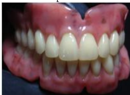
Figura 06 Prótese Superior e inferior finalizadas

Iniciam-se então as fases de acabamento e polimento, etapas de extrema importância para o controle da placa microbiana, uma vez que superfícies polidas facilitam a higienização da prótese e dificultam a aderência de microrganismos. Ao final do polimento, as próteses devem apresentar aspecto liso e brilho adequado.