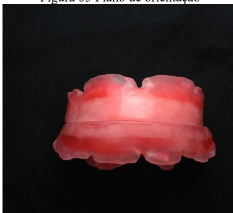
Figura 05 Plano de orientação

A confecção da base de prova representa uma etapa crucial, pois a precisão no registro das características individuais do paciente determinará o planejamento da montagem dentária e das relações intermaxilares, oclusais e estéticas. Por essa razão, as bases de prova devem ser rígidas, estáveis, retentivas e bem adaptadas ao rebordo residual. A correta posição do plano oclusal favorece a função normal dos músculos da língua e bochecha, possibilitando a estabilidade das próteses. Após a obtenção dos modelos funcionais, delimita-se a área basal dos modelos superior e inferior, realizando-se os alívios necessários nas áreas retentivas. Os modelos são hidratados por alguns minutos e isolados com isolante para gesso, utilizando-se então a técnica pó-líquido para confecção das bases. Ao final, obtém-se uma adaptação dentro dos padrões aceitáveis, com a base conformada sobre o modelo de gesso. Sobre põem-se duas lâminas de cera levemente aquecidas e dobradas em forma de bastão, que são acomodadas sobre a crista do rebordo. O plano de cera superior é aquecido e acomodado para acompanhar o perímetro da base de prova com angulação anterior de aproximadamente 45 graus, estabelecendo as dimensões padronizadas de 20 mm na região anterior e 5 mm na região posterior para o modelo superior, e 18 mm na região anterior e 0 mm na posterior para o modelo inferior, ambas com aproximadamente 10 mm de espessura.