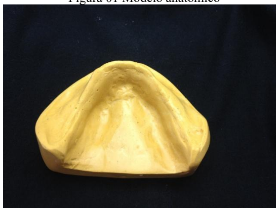
Figura 01 Modelo anatômico