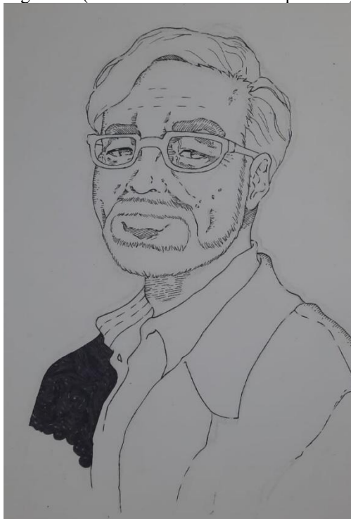
Figura 01 (Barroco - desenho com expressões)