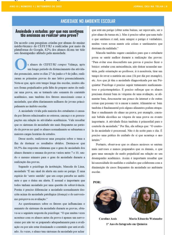
Figura 03. Reportagem sobre Ansiedade no Ambiente Escolar