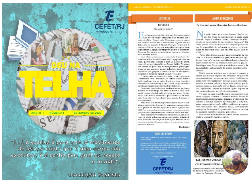
Figura 02. Capa e primeira página do jornal

Fonte: Jornal Deu na Telha - ANO III | NÚMERO 1 | SETEMBRO DE 2022