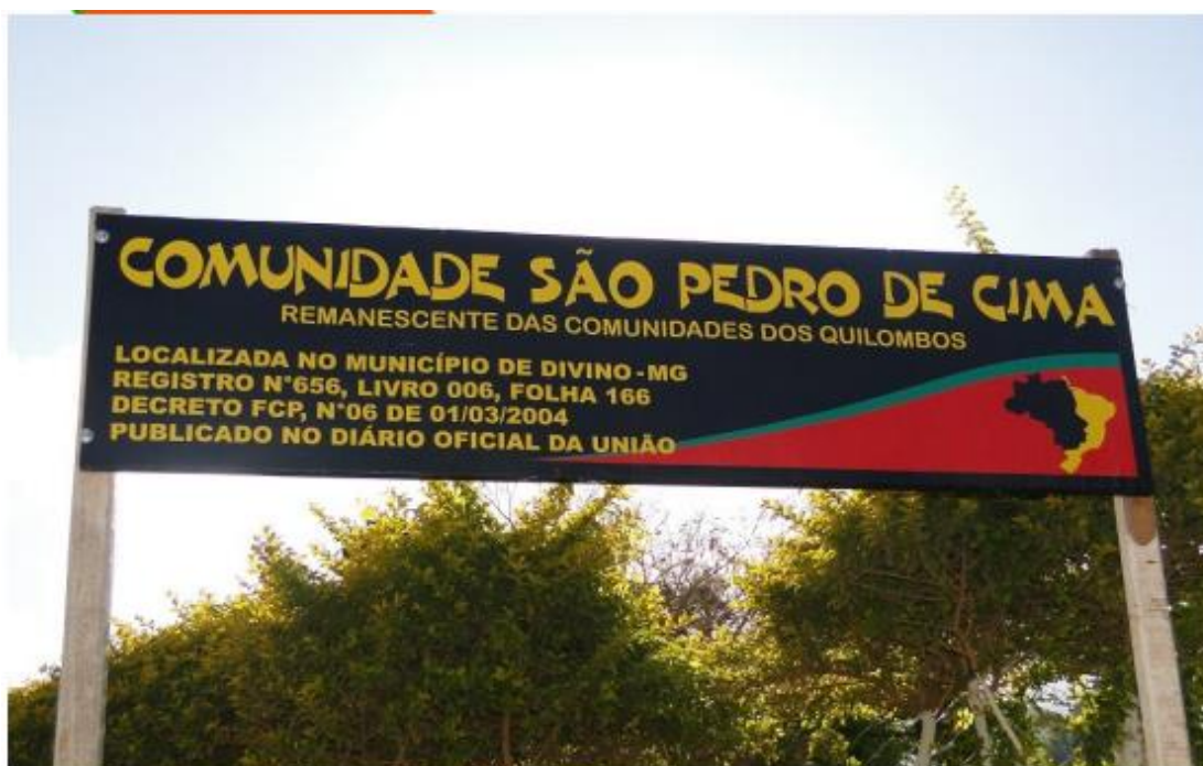
Placa de identificação da comunidade – acervo Ecomuseu

O Movimento Negro Avura, surge a partir da demanda de professores e alunos, a fim de descobrir ou tentar desvendar suas origens. O movimento resiste na medida do possível, a empresa Samarco doa ao Avura instrumentos musicais e já estão planejadas oficinas com professores e alunos. O movimento atua na escola e, também tem ampla participação na disciplina de História da África que é uma das propostas contidas da Lei federal 10.639/2003.