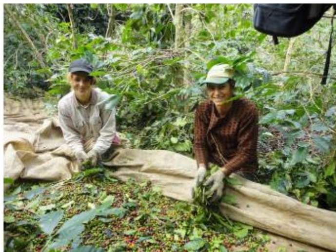
Panha do café