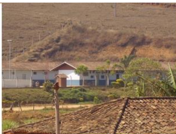
Escola na Comunidade São Pedro de Cima

A Escola Municipal Lia Marta é um palco constante de nossas reuniões com a comunidade, na escola são exibidos frutos do projeto e um local neutro onde todas as crianças oriundas de famílias das mais variadas religiões.