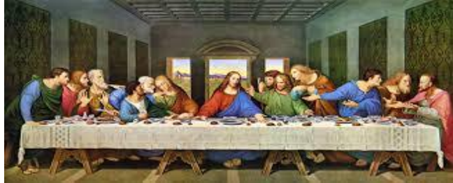
Figura 1 – A última ceia 1945/1497, Leonardo da Vinci