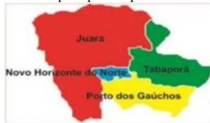
Fig. 01: Municípios que compõem o Vale do Arinos

Neste sentido, trazendo uma realidade geográfica, as acadêmicas desafiaram os estudantes para além do olhar cartográfico, mas o sentimento de pertencimento, reconhecer o lugar de onde é, quantos e quais são essas pessoas que moram em cada município, comparar essas populações e, sobretudo identificar em que região está localizada, que não é um município isolado, mas que compreende os seus limítrofes.