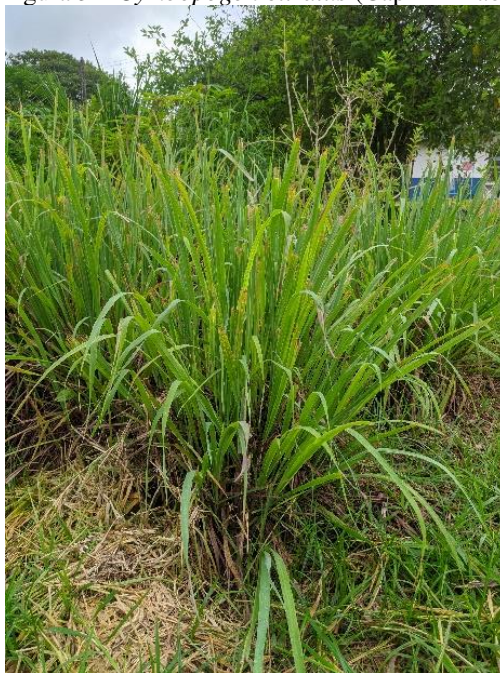
Figura 3 – Cymbopogon citratus (Capim limão)

Local: Núcleo de Farmácia Viva, SES – DF