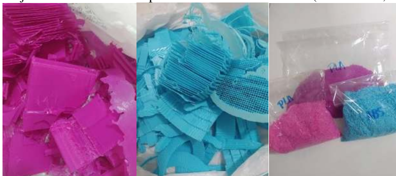
Figuras 1,2 e 3: Rejeitos de materiais de suporte do Labtec 3D – NUTES (PLA E ABS, respectivamente).

A presente pesquisa foi realizada na cidade de Campina Grande-PB. Os resíduos poliméricos obtidos para os experimentos são: o ácido poliláctico (PLA) e o acrilonitrila butadieno estireno (ABS), adquiridos através do Labter 3D-NUTES, que foram retirados e guardados em sacos plásticos e lacrados para evitar contaminação (Figuras 1, 2 e 3).