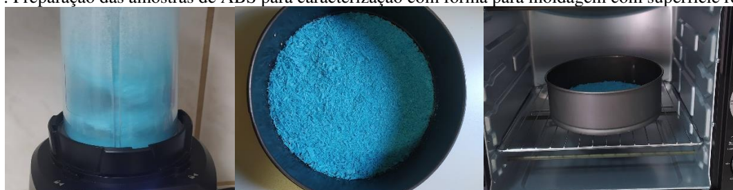
Figura 7: Preparação das amostras de ABS para caracterização com fôrma para moldagem com superfície removível.