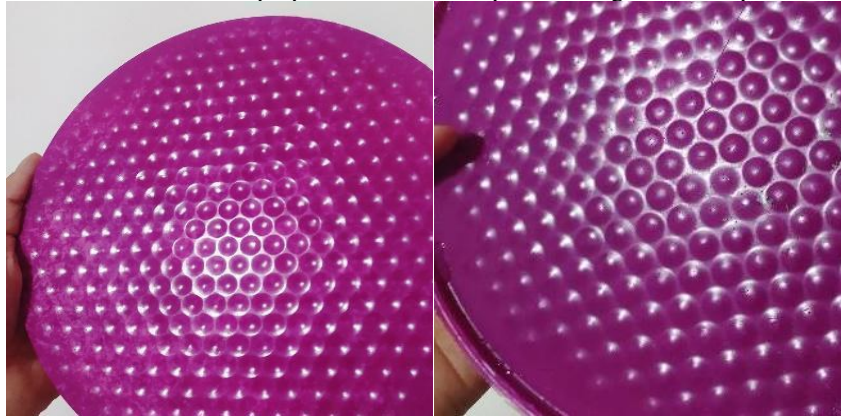
Figura 8: Resultado de amostra de PLA preparada com fôrma para moldagem com superfície inferior removível.