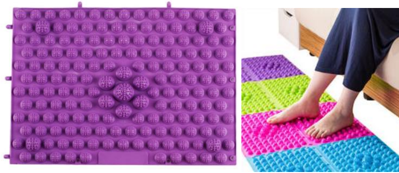
Figura 10: Tapetes sensoriais de silicone.