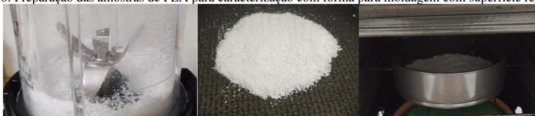
Figura 6: Preparação das amostras de PLA para caracterização com fôrma para moldagem com superfície removível.

Desse modo, percebeu-se através dos testes experimentais, que os materiais responderam de maneira satisfatória a moldagem por aquecimento. As etapas para realização dessas amostras foram: a) trituração do PLA e do ABS; b) colocação do PLA e do ABS triturados na fôrma para moldagem antiaderente com desmoldante; d) forno a uma temperatura de 150°C para PLA (temperatura que se apresentou favorável no teste preliminar) e 180°C para o ABS, como pode-se observar no painel de imagens da Figura 6 e do painel de imagens da Figura 7.