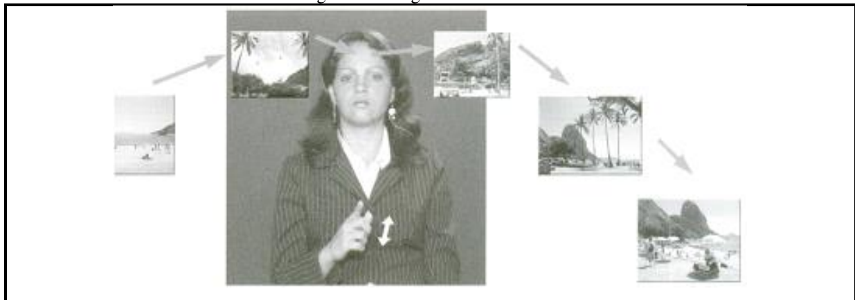
Figura 3 – Imagem do Pensamento

perguntarmos por que isso acontece? Por que muitas vezes agimos dessa forma? Se pararmos para refletir, chegaremos à conclusão de que isso se dá porque se usa, nessas ocasiões, principalmente, a memória fotográfica. Ela nos leva a todas essas ações. Para falar bem em LIBRAS, é importante habituar-se a usar, frequentemente e de modo correto, as expressões faciais, corporais e as mímicas. Também, deve-se evitar copiar ou seguir a estrutura que já conhece da língua portuguesa, falando com surdos por meio do Português Sinalizado. Ressalta-se ainda que, muitas pessoas, poderão decorar rapidamente diversos sinais padronizados da LIBRAS, mas devemos sempre ter em mente que, para ser corretamente entendido e entender os outros, a estrutura da comunicação deve se basear no pensamento visual, como se pode ver na figura 3.