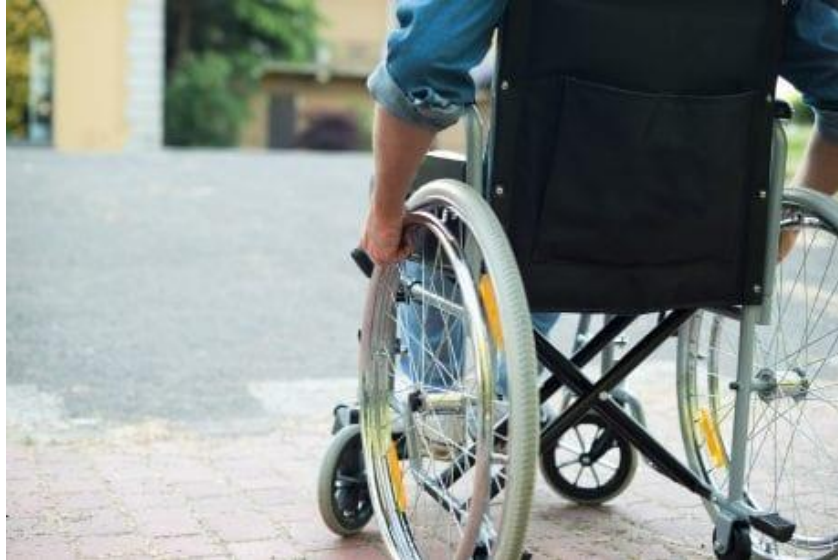
Figura 1 – Estudante com deficiência.

O processo evolutivo da inclusão possui vários marcos históricos, mas apesar disso tem caminhado a passos lentos. Ainda na Declaração de Salamanca (1994) foi definido que as “escolas inclusivas devem reconhecer e responder às diversas necessidades dos seus alunos, acomodando estilos e ritmos de aprendizagem e assegurando uma educação de qualidade a todos, através de currículos apropriados, arranjos organizacionais, estratégias de ensino, uso de recursos e parceria com as comunidades.” A Declaração de Madri (2002), focalizou os direitos das pessoas com deficiência, as medidas legais, a vida independente, entre outros. No Brasil, com a Resolução nº 2/2001, da Câmara de Educação Básica – CEB, do CNE, que instituiu as Diretrizes Nacionais para a Educação Especial na Educação Básica, verificou-se um avanço significativo na perspectiva da universalização e atenção à diversidade, na educação brasileira, com a seguinte recomendação: “Os sistemas de ensino devem matricular todos os alunos, cabendo às escolas organizar-se para o atendimento aos educandos com necessidades educacionais especiais, assegurando as condições necessárias para a educação de qualidade para todos”.