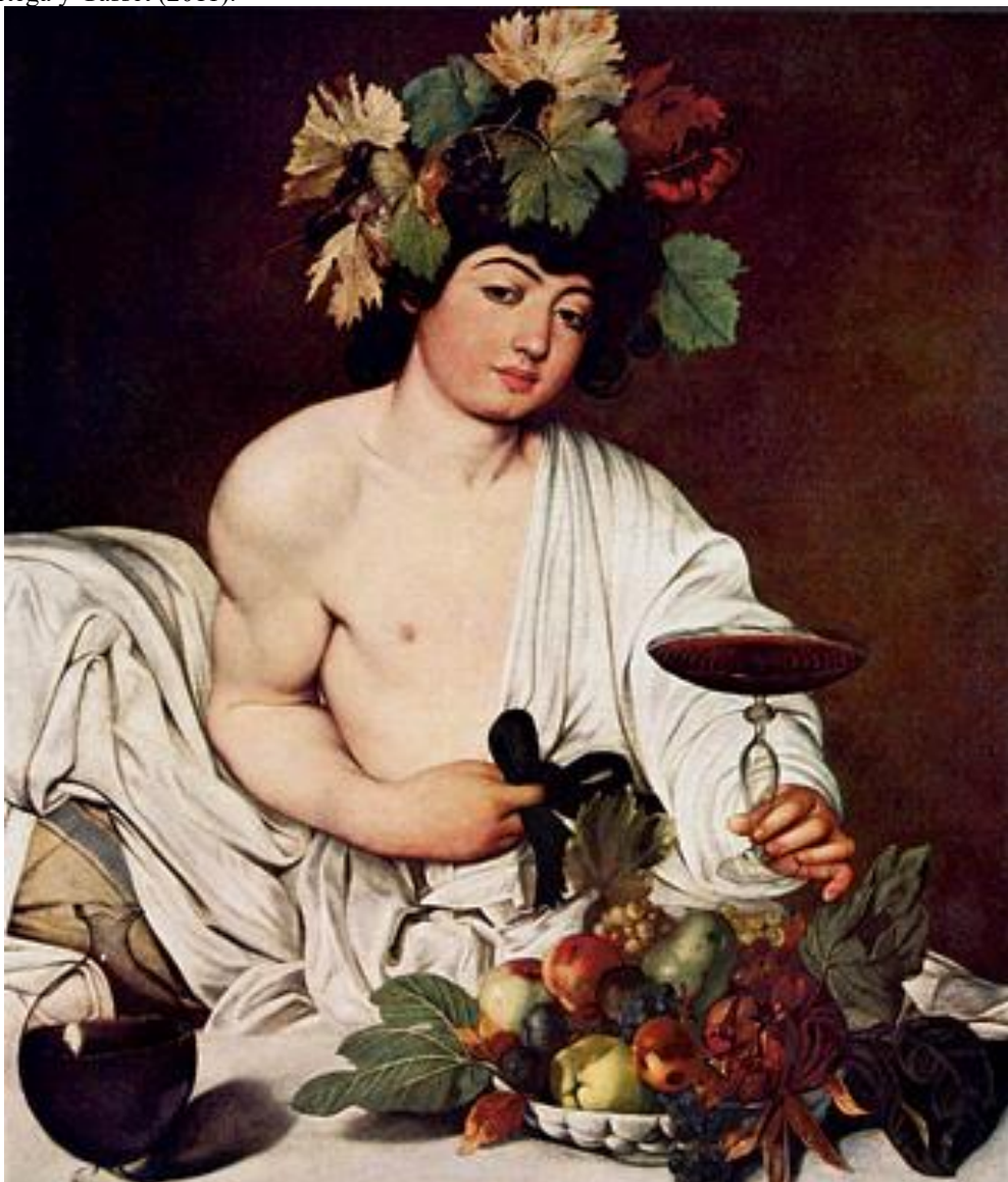
Figura 1. Obra de Velazquez, intitulada “O Triunfo de Baco”. Original da Coleção do Museu del Prado, Madri, Espanha.

É preciso que se diga que a análise de uma obra de arte sempre terá uma leitura ambígua, isto é, as observações a respeito do que está pintado podem variar, da mesma forma que uma doença pode ter diversos fatores de causa, não devendo nem o observador nem o profissional da área da saúde descartar quaisquer delas para o diagnóstico adequado, podem existir diversas interpretações.