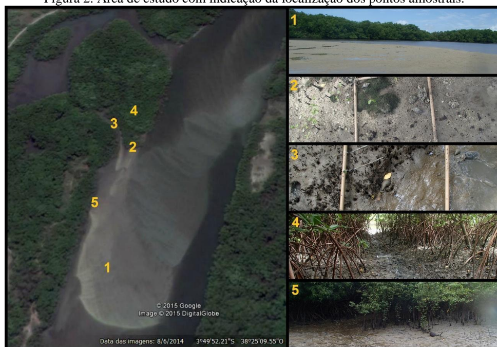
Figura 2. Área de estudo com indicação da localização dos pontos amostrais.