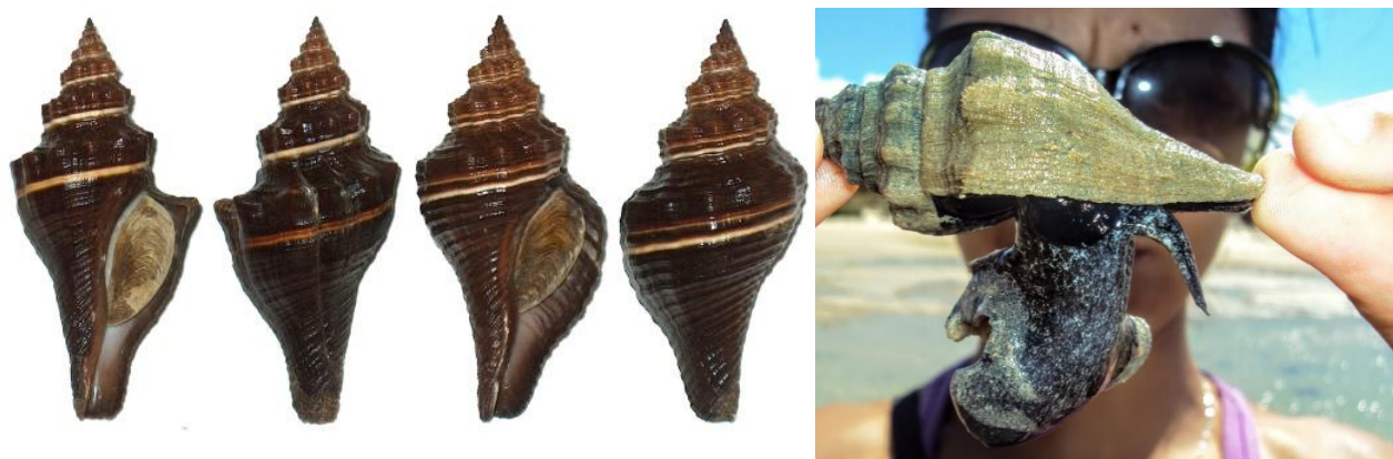
Figura 1. O molusco gastrópode Pugilina tupiniquim . Da esquerda para a direita: Vistas dorsal e ventral da concha de diferentes exemplares; Exemplar vivo exibindo o vivo pé e sifão inalante fora da concha, que é revestida por uma camada de perióstraco.