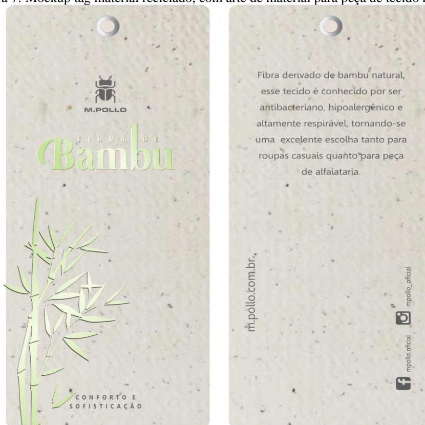
Figura 7: Mockup tag material reciclado, com arte de material para peça de tecido natural.