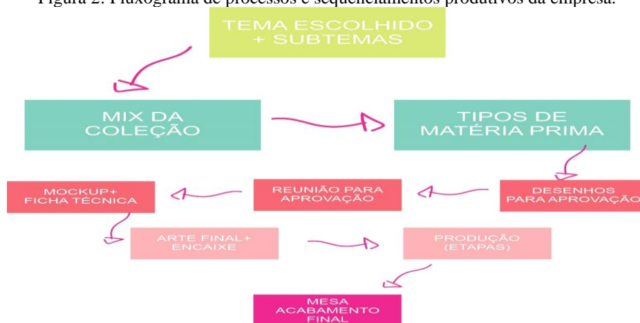
Figura 2: Fluxograma de processos e sequenciamentos produtivos da empresa.

As etapas de criação e o resultado final da estruturação das coleções podem ser observados nas representações visuais dos processos e do desenvolvimento de produtos de moda ( Figuras 2, 3 e 4 ).