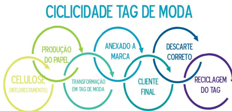
Figura 8: imagem ilustrativa do ciclo de vida do tag de moda. O Ciclo de vida e ciclicidade da tag de moda: do reflorestamento à reciclagem.