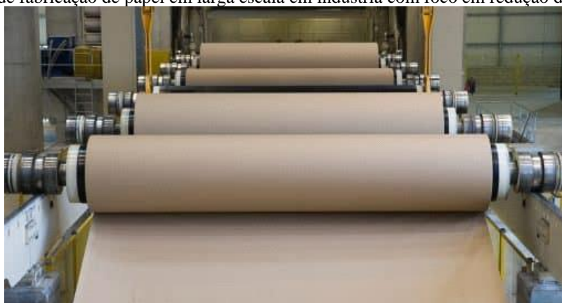
Figura 6: Processo de fabricação de papel em larga escala em indústria com foco em redução de pegada de carbono.