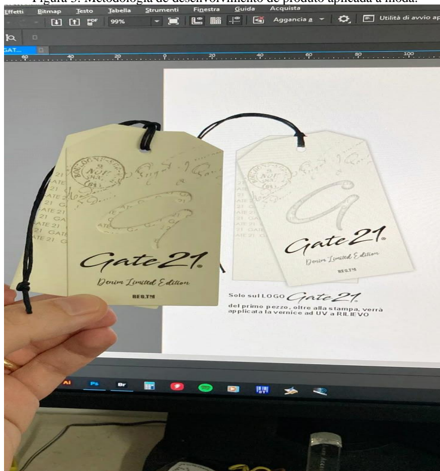
Figura 3: Metodologia de desenvolvimento de produto aplicada à moda.