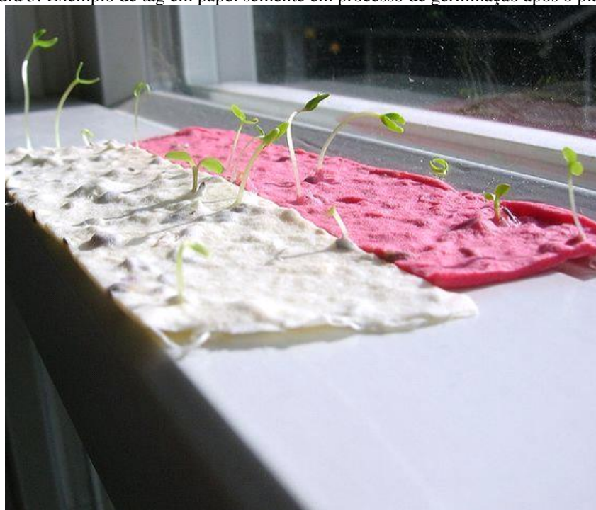
Figura 5: Exemplo de tag em papel semente em processo de germinação após o plantio.